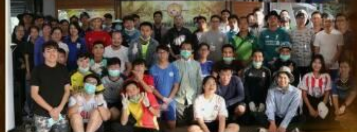
2 ธันวาคม พ.ศ. 2562 ชมรมอนุรักษ์ธรรมชาติ ได้จัดโครงการบำเพ็ญประโยชน์เพื่อถวายเป็นพระราชกุศล เนื่องในโอกาสวันพ่อแห่งชาติ