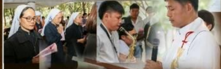
16 ธันวาคม พ.ศ. 2562 นักศึกษาสาขาวิชาคริสตศาสนศึกษา จัดโครงการวันครุคำสอนไทย ณ บริเวณอาคารเรียน ชั้น 1