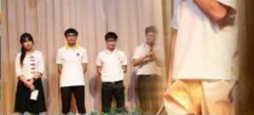
13 พฤศจิกายน พ.ศ. 2562 ชมรมนันทนาการร่วมกับสโมสรนักศึกษา วิทยาลัย แสงธรรม ได้จัดงานดนตรีสร้างสรรค์ประพันธ์บทเพลง LIVE LOVE LORD "โซ่พลังของเราในทางที่ดี ปลุกฟังความเป็นพี่น้อง ถัดตามองค์พระเยซูเจ้า"