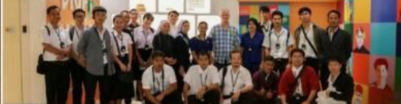
26 กันยายน 2562 ชมรมการศึกษาวิทยาลัยแสงธรรม จัดโครงการทัศนศึกษา ในหัวข้อ "เรียนรู้เรื่องดวงดาว วิทยาศาสตร์และเงินทอง สู่การใช้ชีวิตในจานอวกาศ" ณ พิพิธภัณฑ์เรียนรู้การลงทุน (INVESTORY)